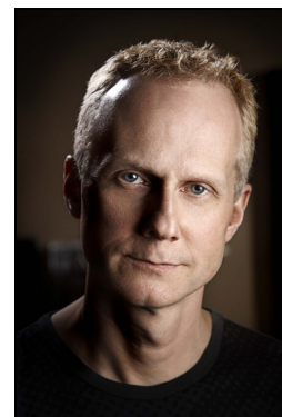
Niels Arden Oplev

Target Distribution ApS Godthåbsvej 26B 2000 Frederiksberg Salg: [+45] 2789 1630 ordre@targetdistribution.dk Promotion: [+45] 2789 1631 thomas@targetdistribution.dk